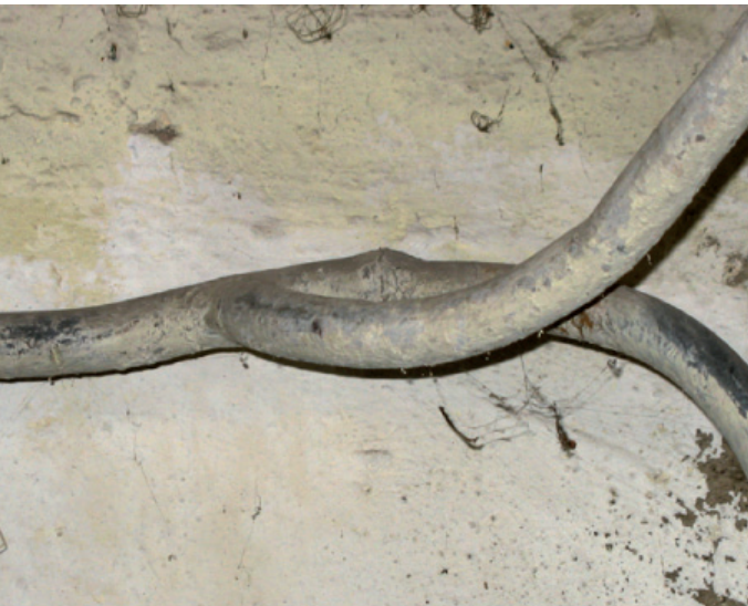
Hier steht eine Bildunterschrift

Das Nerven- und Blutgift Blei reichert sich im Körper an und beeinträchtigt besonders die Entwicklung des Nervensystems. Kinder nehmen im Vergleich zum Erwachsenen wesentlich mehr Blei aus der Nahrung und dem Trinkwasser auf. Selbst Bleikonzentrationen von 0,010 bis 0,025 mg/l im Trinkwasser beeinträchtigen die Blutbildung und die Intelligenzentwicklung vor allem vor der Geburt und während der ersten Lebensjahre. Deshalb sind schwangere Frauen, Ungeborene, Säuglinge und Kleinkinder besonders gefährdet und vor der Aufnahme von Blei zu schützen. Gesundheitlich bedeutend ist in erster Linie die schleichende Belastung durch die Aufnahme kleiner Bleimengen. Bei Erwachsenen wird das aufgenommene Blei ausgeschieden oder in den Knochen eingelagert. Dort kann es in Phasen eines erhöhten Stoffwechsels (z. B. während einer Schwangerschaft) wieder in das Blut gelangen. Dies erklärt, warum neben Ungeborenen und Kleinkindern auch Frauen besonders geschützt werden müssen.